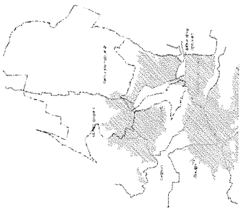
aree soggette a rischio idrogeologico